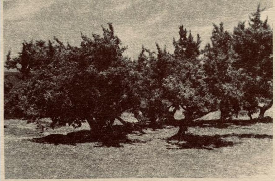
“Büyük Kozalaklı Katran Ardıcı”nın deniz kenarındaki ağaçları-Dydim, Mavişehir yakını Tavşanburnu (Aydın Orman İşletmesi, Dinlenme Kampında koruma altında)